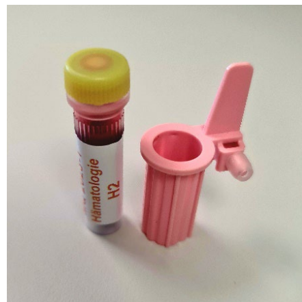
Figura 2: Supporto per sangue capillare