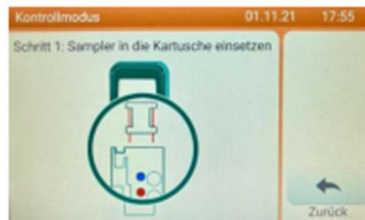
Figura 1: Inserire la cartuccia

A questo punto è possibile digitare il nome del campione (Figura 3). Non è necessario specificare le sottopopolazioni leucocitarie (linfociti, granulociti, ecc.).