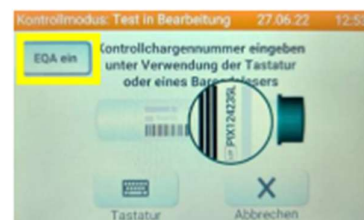
Figura 2: Premere il tasto EQA